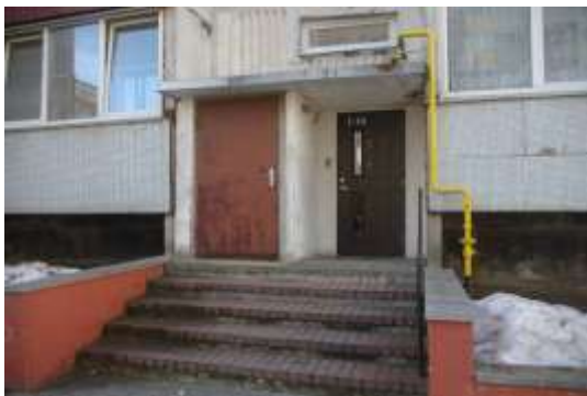
Dzīvojamā ēka ar kadastra apzīmējumu 1700 012 0459 001