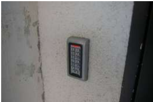
Dzīvojamā ēka ar kadastra apzīmējumu 1700 012 0459 001