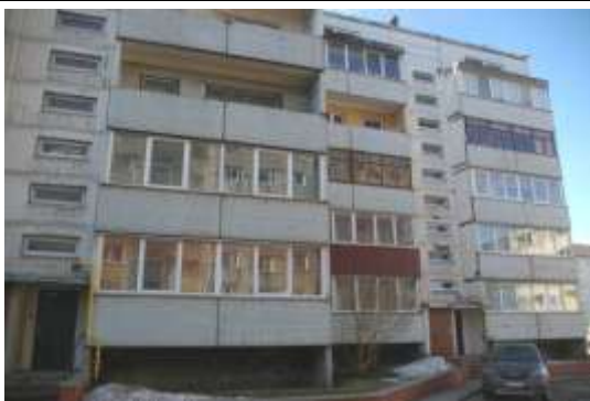
Dzīvojamā ēka ar kadastra apzīmējumu 1700 012 0459 001